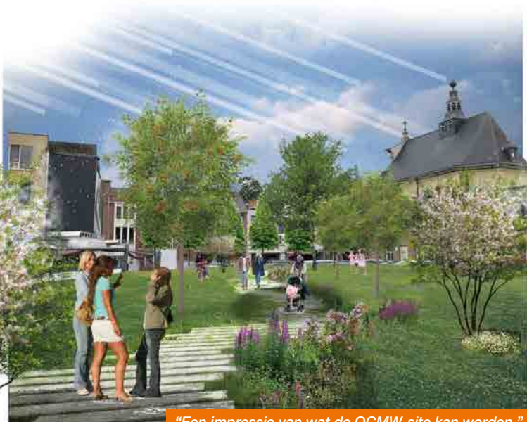
“Een impressie van wat de OCMW-site kan worden.”

S AMEN droomt van een Ninove met een aantrekkelijker stadscentrum en meer groen. Wij willen onze binnenstad aantrekkelijk maken en daarom willen wij een nieuw stadspark voorzien in de binnenstad, op de voormalige OCMW-site . Dit ontmoetings- en belevingspark kan een verbinding met de Dender maken en onze rivier een meer centrale plaats in de stad geven, met de mogelijkheid tot terrasjes en wandelpaden langs het water, plaats om te spelen of een gezellige barbecue te houden met vrienden en familie. De Kaaischool renoveren we voor bewoning en als gezellige ontmoetingsplaats met terrasjes en ruimtes die een tijdelijke invulling kunnen krijgen: pop-up bar of restaurant, openluchtfilm, tijdelijke tentoonstellingen, circusoptredens tijdens de Donderdagen en zoveel meer. De weiden achter de Burchtdam en de Brusselstraat blijven groen met een grote vijver waar de Ninovieters kunnen gaan wandelen of sporten.