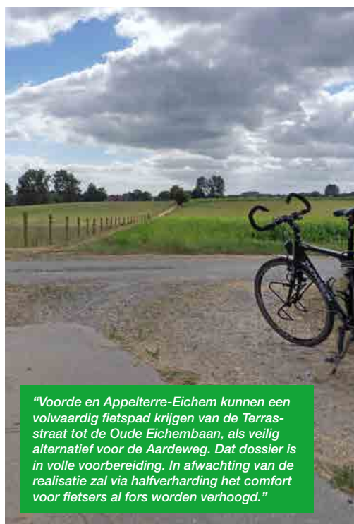
“Voorde en Appelsterre-Eichem kunnen een volwaardig fietspad krijgen van de Terrasstraat tot de Oude Eichembaan, als veilig alternatief voor de Aardeweg. Dat dossier is in volle voorbereiding. In afwachting van de realisatie zal via halfverharding het comfort voor fietsers al fors worden verhoogd.”

gen tussen alle deelgemeentes en de stad en de buurgemeentes . Waar de straat voldoende breed is voorzien we verhoogde fietspaden, aparte fietswegen, los van de autoweg of met zo weinig mogelijk kruisingen met autowegen en absolute voorrang voor de fietsers (zoals fietsstraten). Zo krijgen we de Ninovieters op de fiets , en creëren we een veilige fietsverbinding voor onze schoolgaande jeugd. Verder willen we investeren in de kwaliteit van onze bestaande fietsverbindingen en voetpaden.